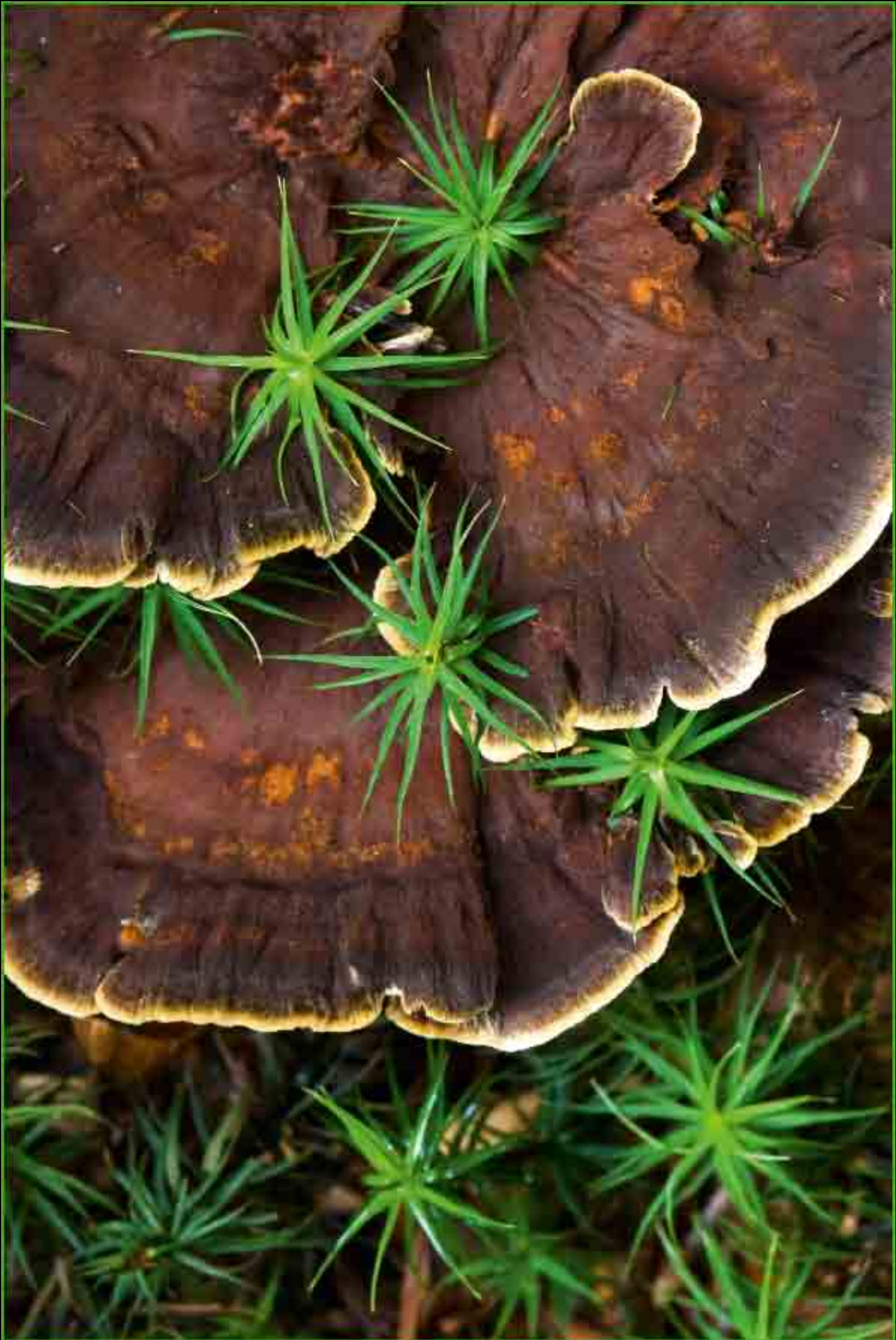
Durchwachsen - Schmetterlingstramete, Neuschönau