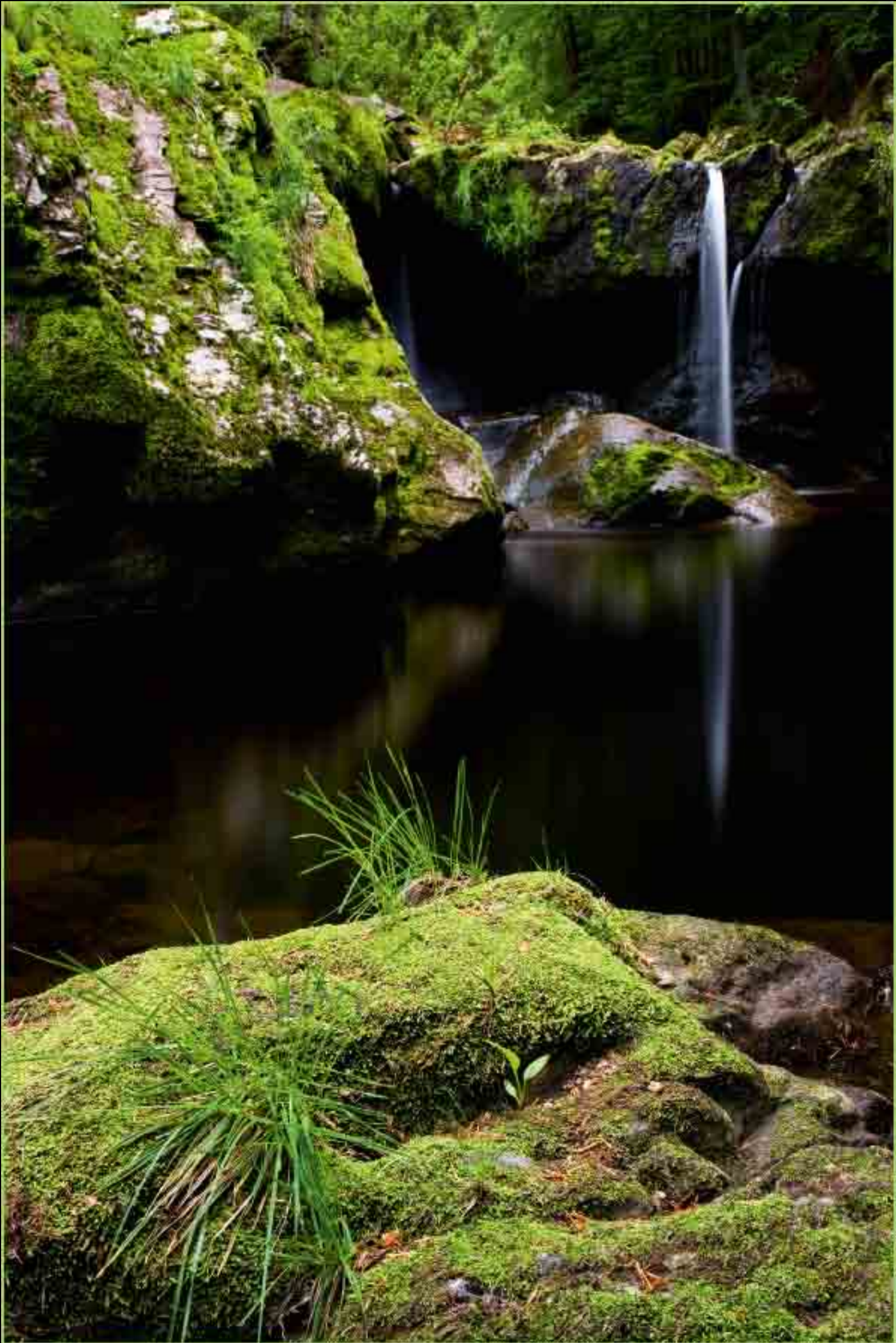
Wasserfall - Steinklamm, Spiegelau