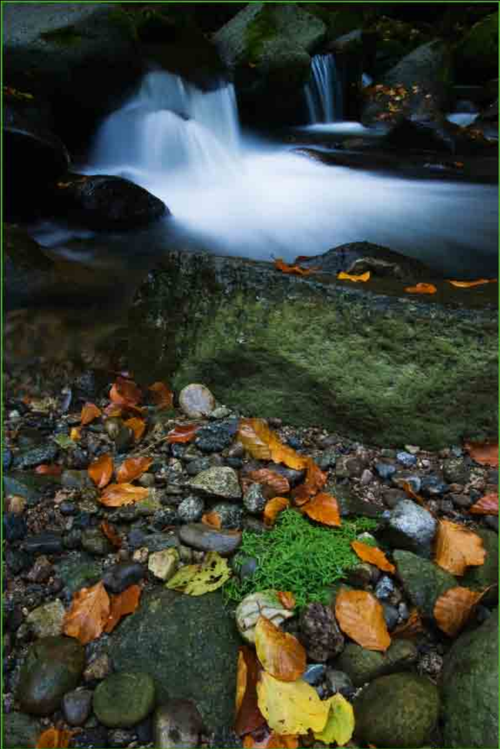
Herbstanfang - Buchberger Leite, Ringelai