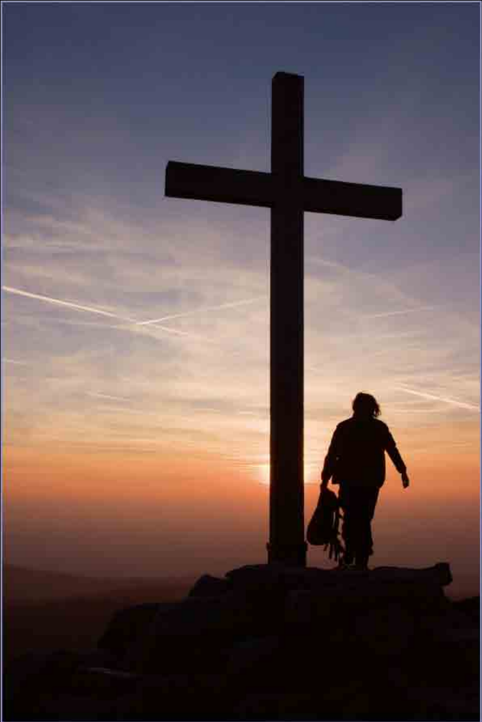
Abends am Lusen - Nationalpark Bayerischer Wald