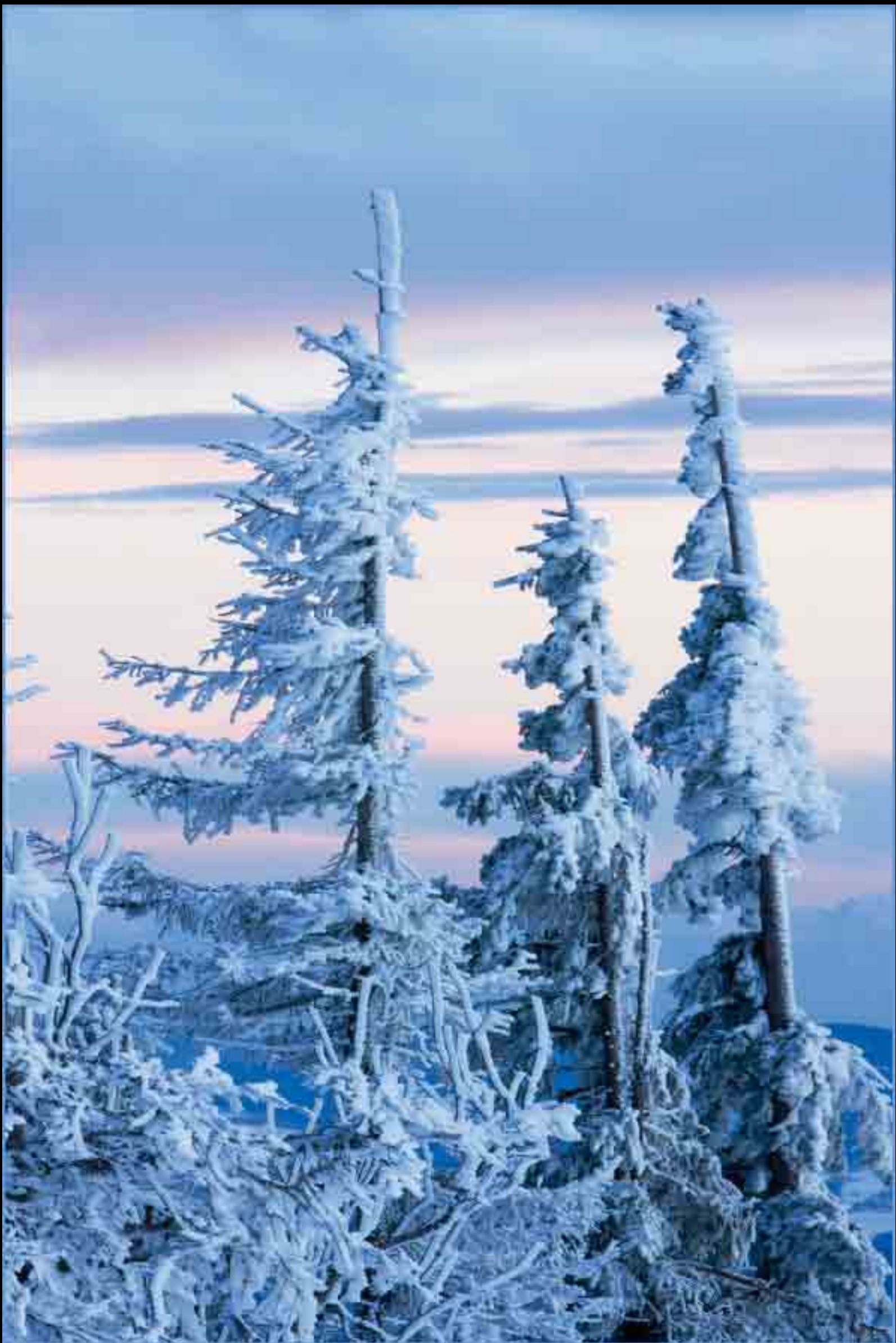
Lusengeister - Lusen, Nationalpark Bayerischer Wald