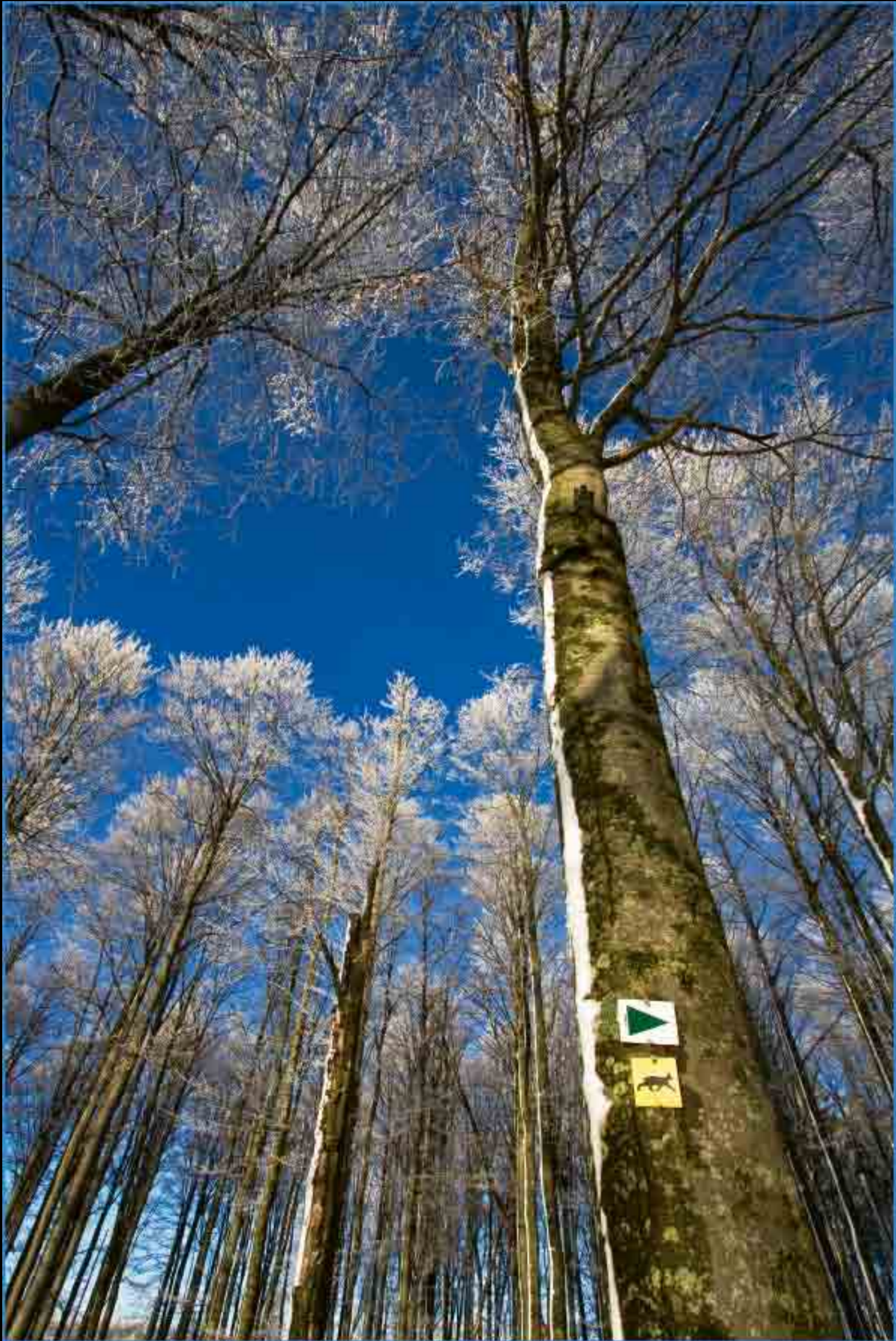
Winterwanderung - Böhmweg, Waldhäuser