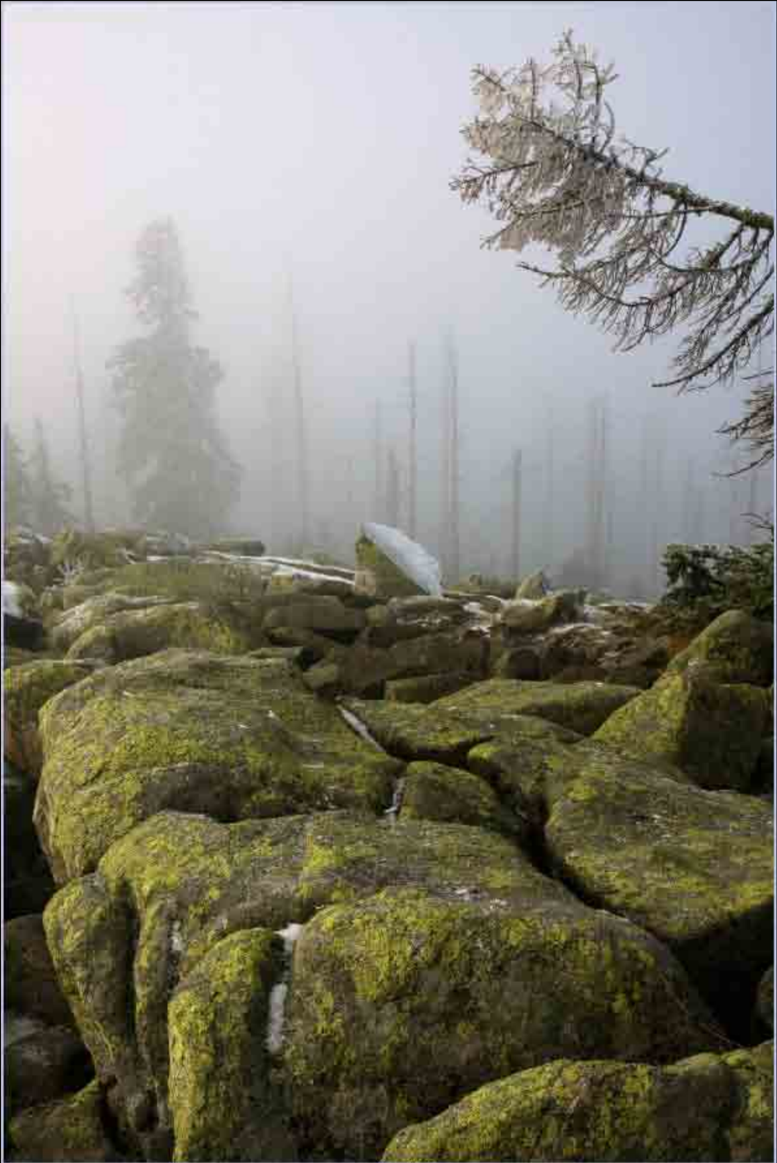
Morgennebel - Lusen, Nationalpark Bayerischer Wald