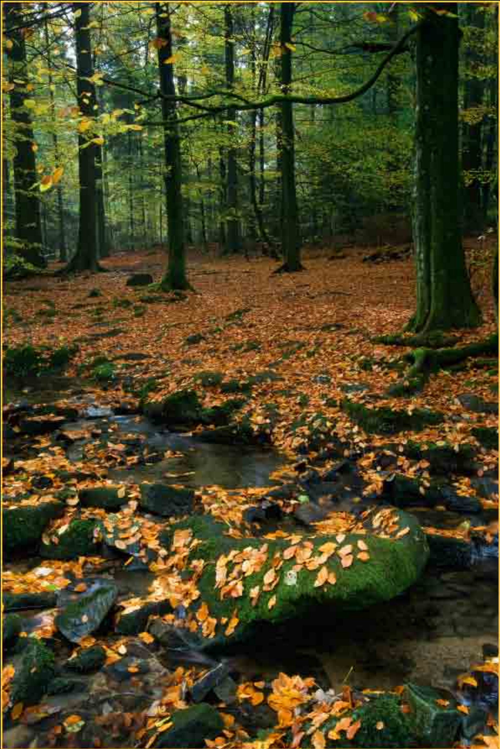
Buchenwald - Saußbachklamm, Waldkirchen