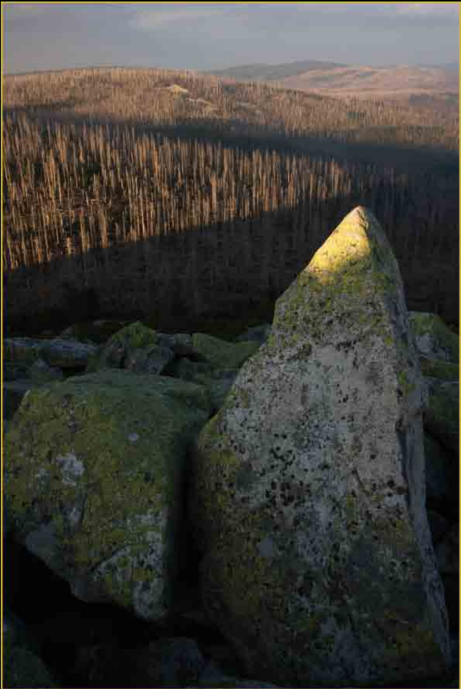
Lusengranit - Nationalpark Bayerischer Wald