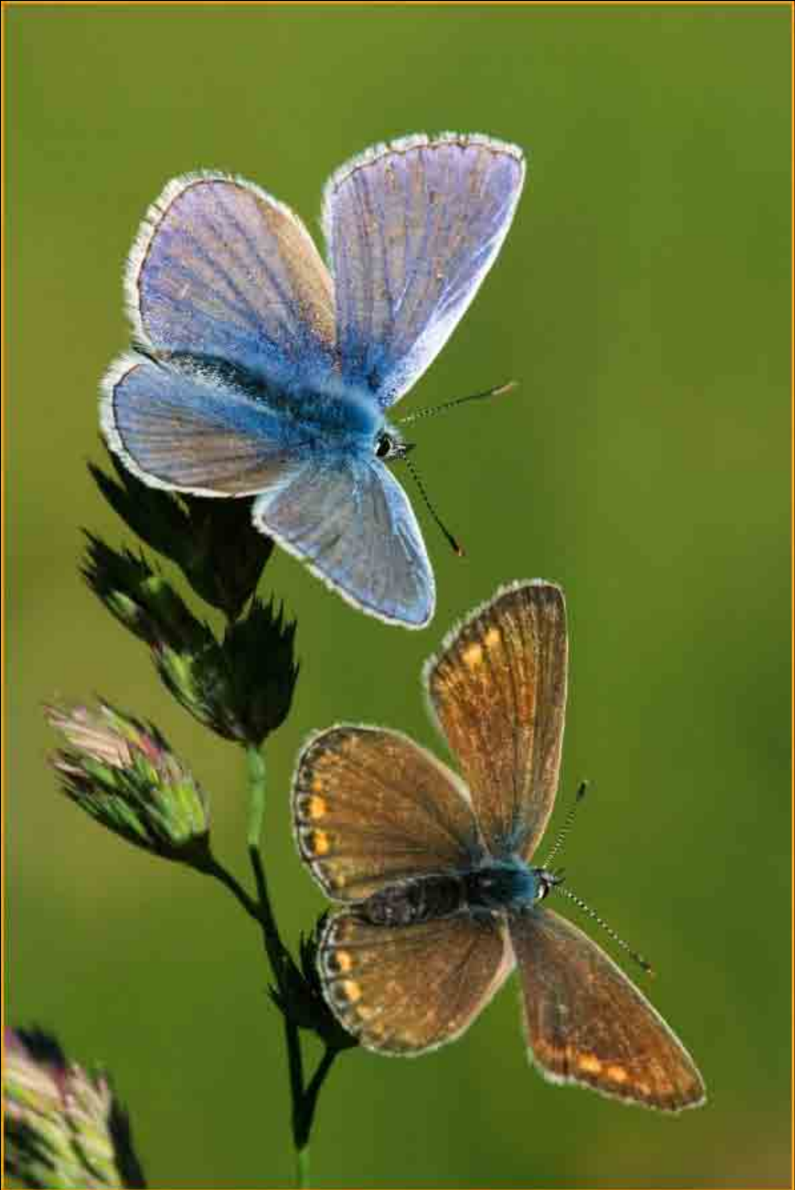
Pärchen - Bläulinge, Neuschönau